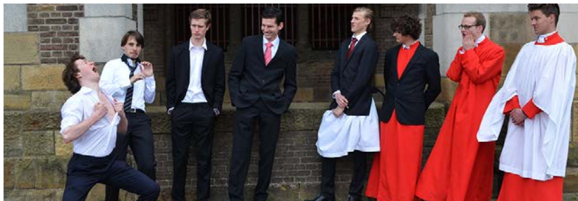
De Haerlemsche Heeren

Werken van Johann Strauss, Franz Lehár, Rodgers en Hammerstein, Billy Joel en Rick Astley.